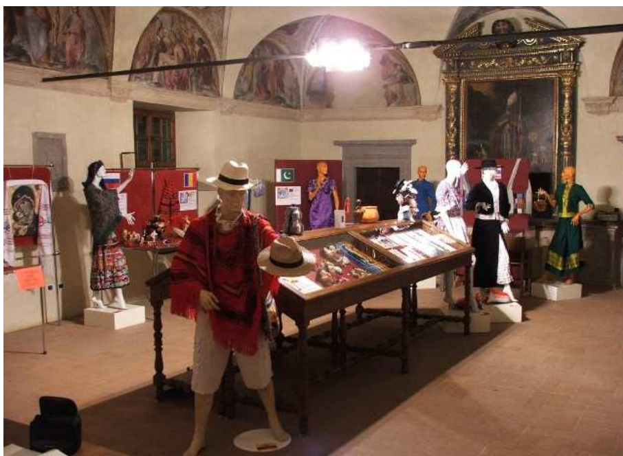
La mostra ospitata nell'oratorio della Madonna delle Grazie .

La mostra ha avuto un grande successo, grazie alla collaborazione con le scuole della città che hanno portato molte classi a visitarla in orario scolastico; abbiamo registrato nei 15 giorni di apertura un numero di visitatori intorno alle 800 persone, cosa che ci ha reso molto soddisfatti dell'evento e per la quale non possiamo non ringraziare i rappresentanti delle comunità straniere di Sansepolcro.