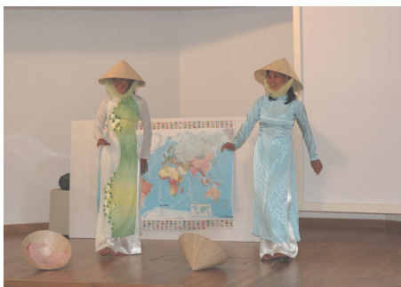
Visita a Loppiano

Il progetto formalmente è iniziato nel luglio del 2008 con alcuni incontri che abbiamo organizzato all'interno delle iniziative proposte dalla Par-