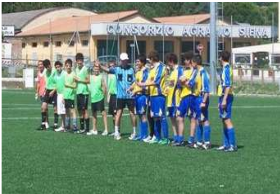
Le squadre della Parrocchia di Santa Maria e del Centro Giovani di Sansepolcro aprono il torneo

Il secondo appuntamento rivolto ai ragazzi è stata la festa di carnevale di quest'anno, per la quale dobbiamo ringraziare il gruppo "Angeli della Speranza" della Parrocchia della Cattedrale di Sansepolcro, che hanno animato la giornata con giochi e musica.